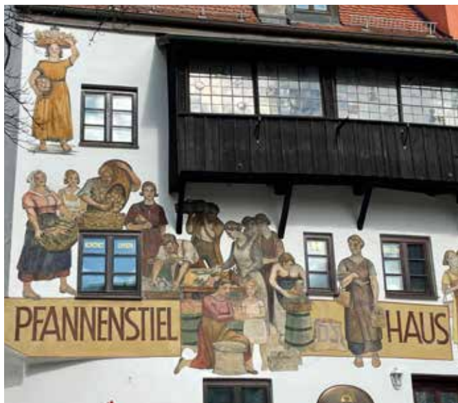
Die Sanierung der Fassadenmalerei am Landsberger Pfannenstielhaus wurde vom Historischen Verein gefördert.